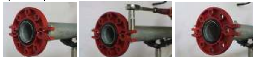
Рис. 1. Монтаж накидного разъемного фланца «LEDE».